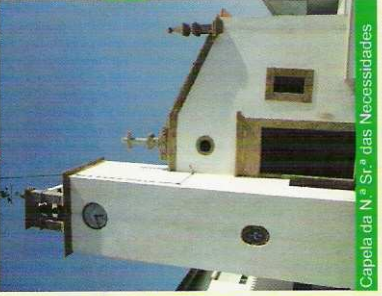
Capela da N.ª Sr.ª das Necessidades