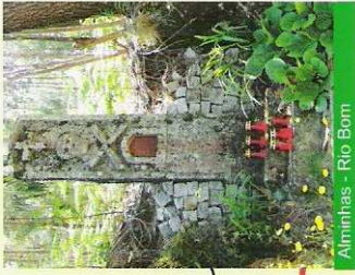
Alminhas - Rio Bom

Hoje, esta celebração anual, mantendo embora as raízes profundas da sua origem - talvez em moldes algo diferentes couros tempos - derivou para um concurso pecuário assistido por um júri, com o patrocínio de serviços do Estado, da Câmara Municipal e de empresas ligadas ao sector, que escolhe os melhores exemplares que os criadores sujeitam ao seu veredicto, de acordo com as regras estabelecidas e aos quais são entregues os prémios correspondentes.