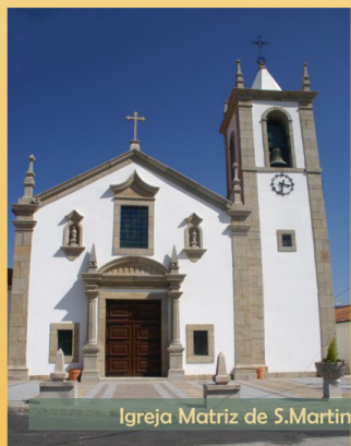
Igreja Matriz de S. Martinho