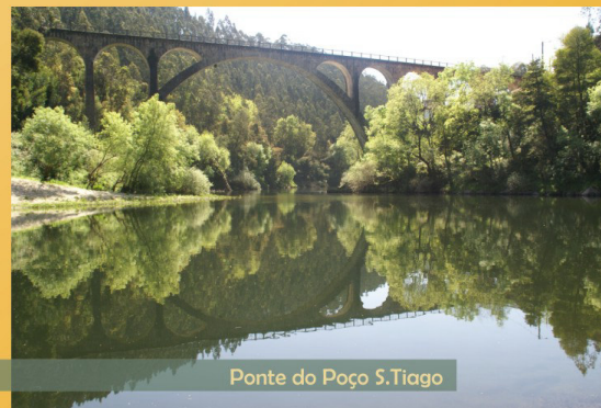
Ponte do Poço S. Tiago