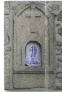
Alminhas de Santo Estevão em Couto de Cima

O percurso atravessa alguns bosques de pinheiros, eucaliptos, acácias, carvalhos e sobreiros, entrecortados por pequenas linhas de água que percorrem toda a encosta. Nestas linhas de água, é visível a existência de pequenas construções - moinhos de água - que outrora trabalhavam incessantemente na moagem dos cereais. Os espigueiros são também uma presença constante e inseparável deste processo do cultivo do milho, surgindo isolados ou agrupados, com eiras comunitárias, demonstrando deste modo, a vivência comunitária das suas gentes. O exemplo mais paradigmático é a Eira Comunitária da Aldeia dos Amiais, a qual exibe sete canastos ou espigueiros, como habitualmente são designados.