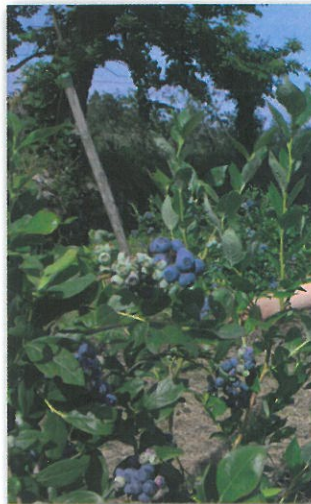
Campo de Mirtilos

O percurso desenvolve-se igualmente por caminhos que, no passado serviam de ligação entre as várias aldeias e a sede de freguesia (Vila de Couto de Cima), sendo na sua maior parte trilhados pelos percursos fúnebres e romarias de então. No decorrer deste percurso é também visível a grande ligação da população com a atividade agrícola, em especial no cultivo do milho e hortícolas e, mais recentemente, no cultivo dos pequenos frutos, em especial, o mirtilo, distribuídos pelos socalcos, talhados na vertente da serra.