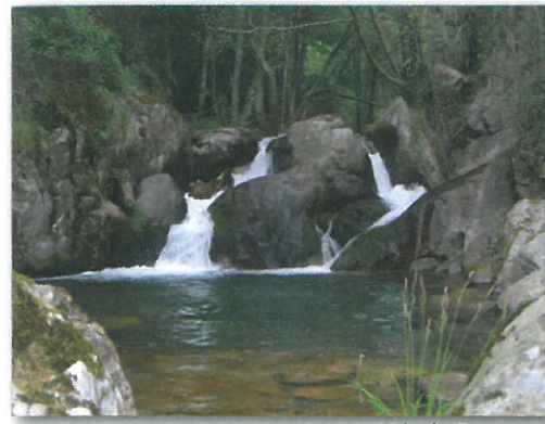
Vale do Rio Gresso