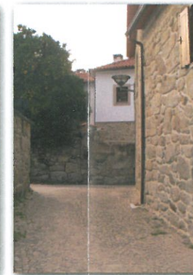
Aldeia dos Amiais