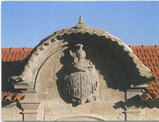
Brasão na Casa da Fonte em Couto de Baixo

Este percurso leva-nos a visitar duas das aldeias mais históricas da freguesia de Couto de Esteves. Na aldeia de Couto de Baixo, situada na zona onde o relevo é mais acidentado, destaca-se ao fundo do casario a Casa da Fonte. Este solar erigido entre os séc. XVI e XVII, foi residência da ilustre família Sequeira e Quadros e aqui sobressai pela sua grandeza, e não menor nobreza, o brasão situado no topo da porta principal, e que confirma a importância da família neste território, que em tempos fez desta casa sua residência.