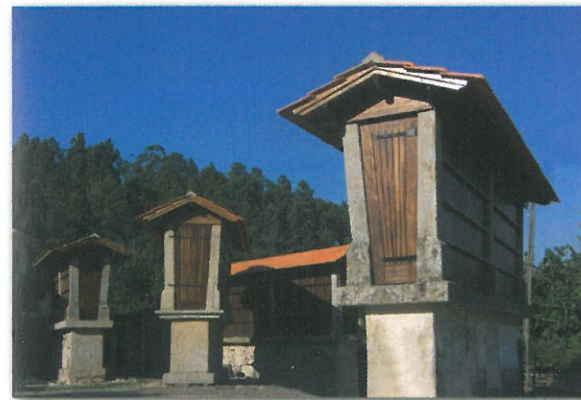
Canastos em Eira Comunitária na Aldeia dos Amiais

O percurso atravessa alguns bosques de pinheiros, eucaliptos, acácias, carvalhos e sobreiros, entrecortados por pequenas linhas de água que percorrem toda a encosta. Nestas linhas de água, é visível a existência de pequenas construções - moinhos de água - que outrora trabalhavam incessantemente na moagem dos cereais. Os espigueiros são também uma presença constante e inseparável deste processo do cultivo do milho, surgindo isolados ou agrupados, com eiras comunitárias, demonstrando deste modo, a vivência comunitária das suas gentes. O exemplo mais paradigmático é a Eira Comunitária da Aldeia dos Amiais, a qual exibe sete canastos ou espigueiros, como habitualmente são designados.