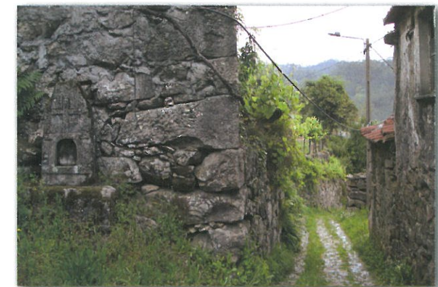
Aminhas e Caminho Tradicional em Catives

O percurso da Pedra Moura leva-nos também a conhecer o registo histórico/patrimonial mais antigo da freguesia de Couto de Esteves – a Anta da Cerqueira - monumento megalítico, testemunho da presença de pequenas comunidades humanas em Couto de Esteves, há cerca de 5000 anos atrás.