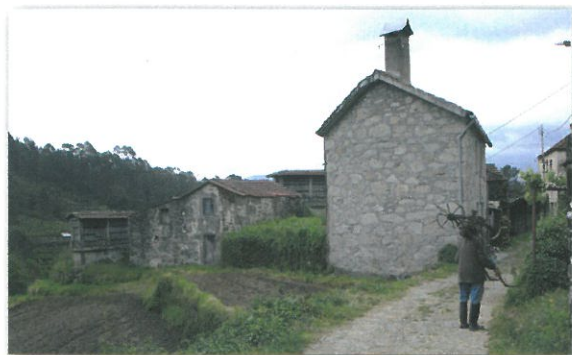
Aldeia de Catives