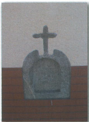
Alminhas em Paradela

Este percurso acompanha muitas vezes as águas da Ribeira e os socalcos serpenteados por levadas e por laranjais, dando a este trilho um valor acrescentado em termos de contacto com a natureza por quase não passar por aglomerados. Remata com a chegada ao lugar do Soutelo junto a um Cruzeiro de granito que ficou a substituir a antiga capela da Sta. Eufémia já inexistente.