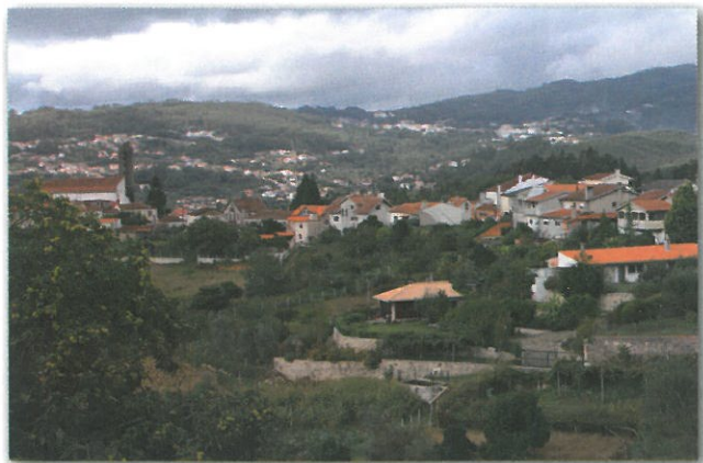
Aldeia de Paradela

Ao longo deste percurso também se pode perceber a fé que estas comunidades têm com a igreja e em especial no culto dos santos com a passagem nas capelas de Nossa Senhora da Boa Hora (Penouços), Santa Eufémia (Soutelo) e em alguns exemplares de Alminhas.