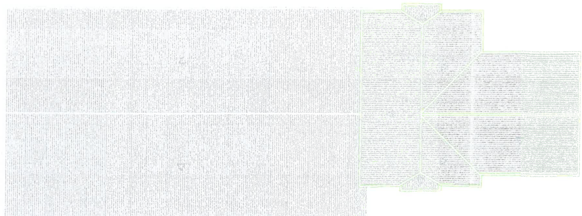
Planta de Situação